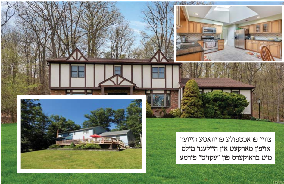
צוויי פראכטפולע פריוואטע הייזער אויפ'ן מארקעט אין היילענד מילס מיט בראוקערס פון "עקזיט" פירמע

די שטימונג אין "היילאנד מילס" קווארטאל איז געווארן היבש פאזיטיוו געשטימט אין די פארלאפענע טעג, נאכדעם וואס א גרופע היימישע משפחות האבן אריין געגעבן א קלאגע אין פעדעראלן געריכט איבער געציילטע לאקאלע איינוואוינער און "האום אסאסיעשאן" מיטגלידער וואס פירן א שווערע דיסקרימינאציע קריג קעגן די היימישע אידן.