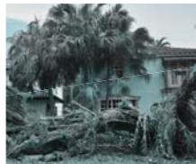
Natural Disaster Strikes