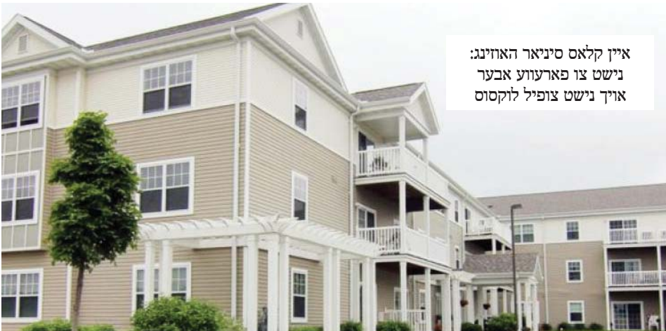
איין קלאס סיניאר האווינג: נישט צו פארעווע אבער אויך נישט צופיל לוקסוס

ביים היימישן ציבור אין ניו יארק איז דער באגריף פון "סיניאר האווינג" נאך אין די גאנץ ערשטע פאזעס, מיט בלויז איין אזא אפיציעלע דעוועלאפמענט אויפ'ן מארקעט, אין קרית יואל ראיאן, אבער די אינדוסטריע אין אלגעמיין האלט ביי איינע פון די בעסטע עפאכעס אויף דעם געביט.