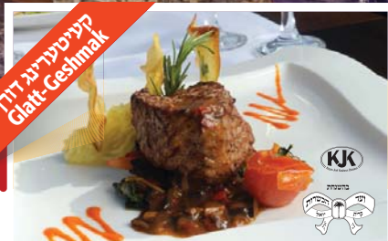
קייטערניג דוד Glatt-Geshmak