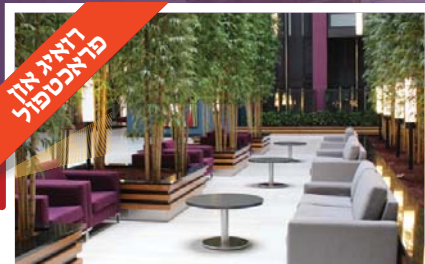
פראכטפול דיאג און פראגראם