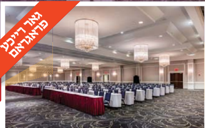
גאר ריינע פראגראם