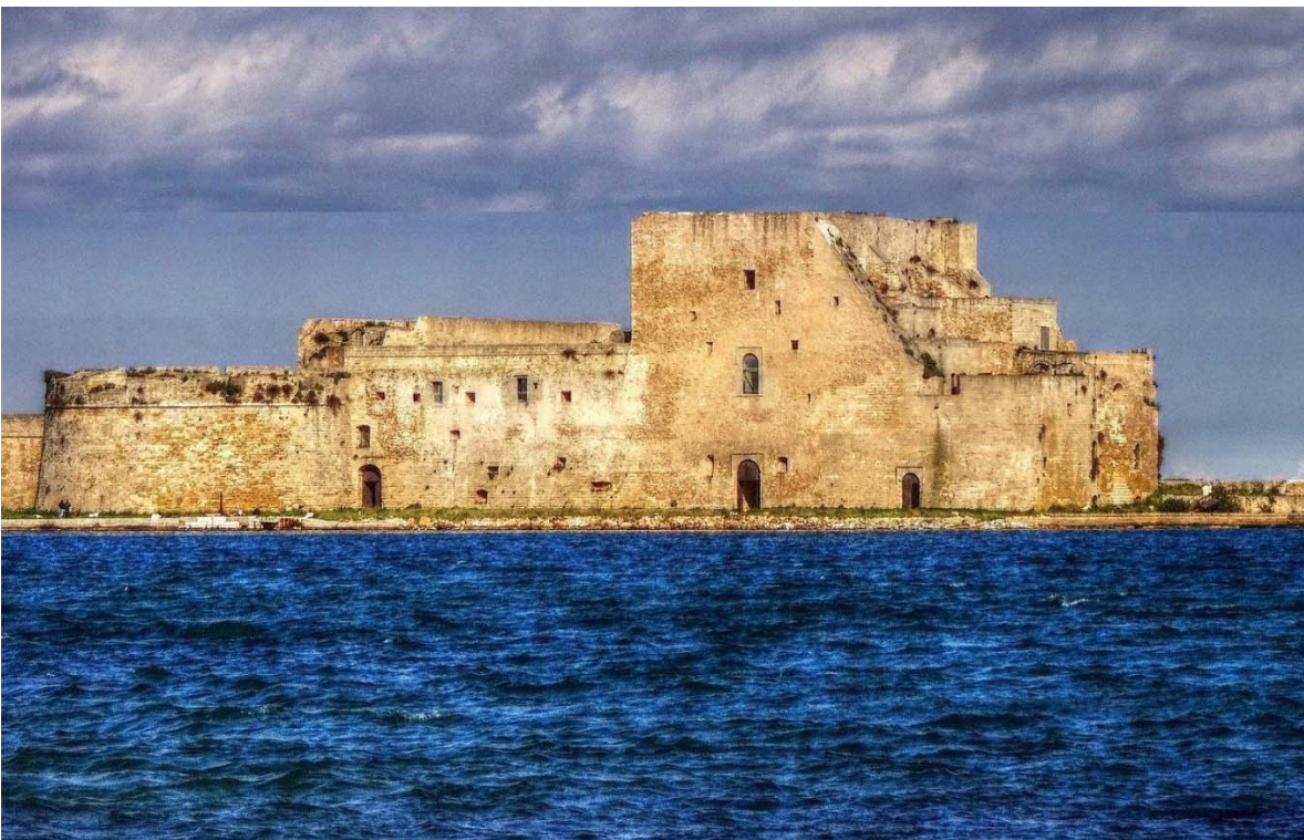
Il Castello Alfonsino – di Mare