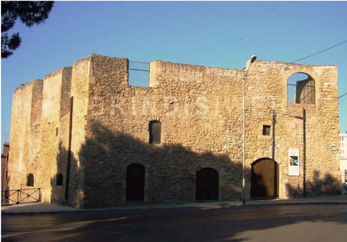
Il Torrione San Giacomo