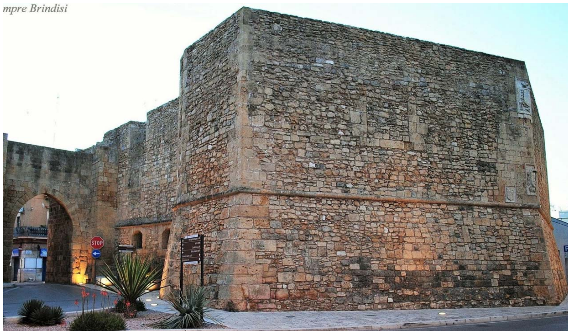
Il Torrione Carlo V