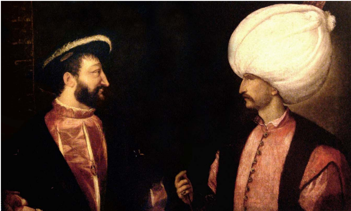
Francesco I e Solimano il Magnifico