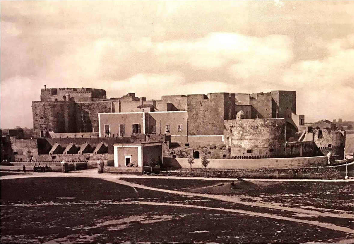
Il Castello svevo – di Terra