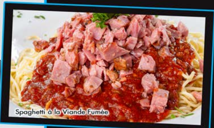
Spaghetti à la Viande Fumée