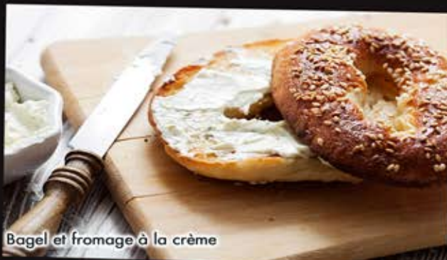
Bagel et fromage à la crème