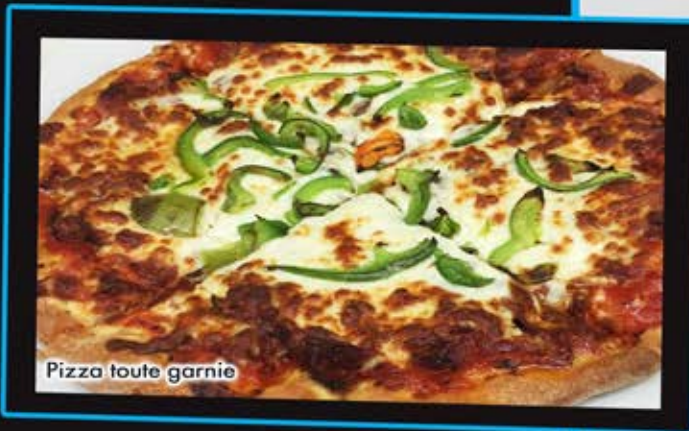
Pizza toute garnie