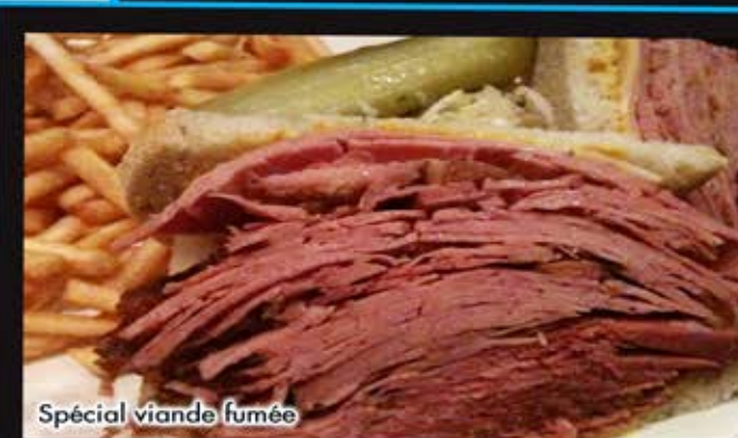
Spécial viande fumée

Ajoutez un choix de salade (du chef ou César) Extra 3.95