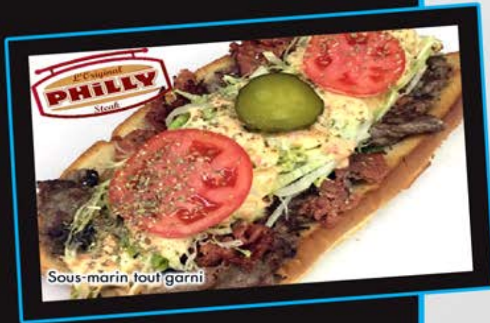
Sous-marin tout garni