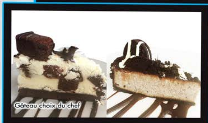
Gâteau choix du chef