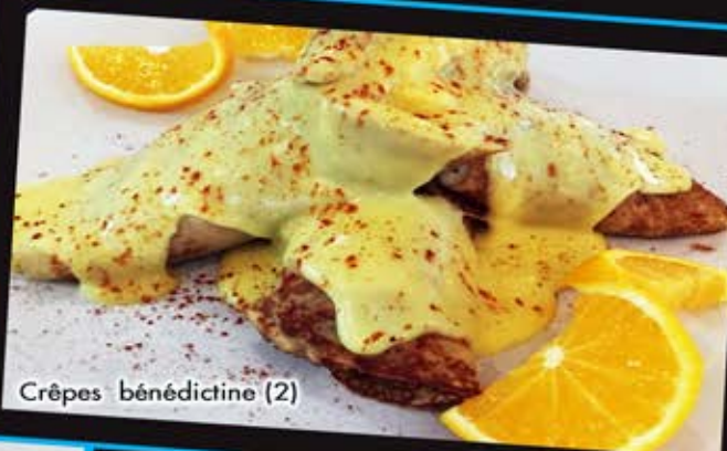
Crêpes bédicotine (2)

1 oeuf, 1 pain doré ou 1 crêpe ou 1 choix de viande (avec petit lait ou jus) 9 95 Servis avec fruits et pomme de terre