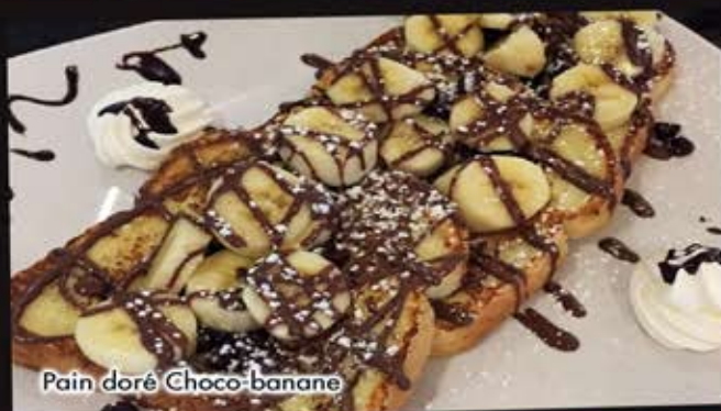
Pain doré Choco-banane