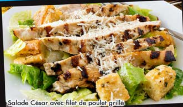
Salade César avec filet de poulet grillé