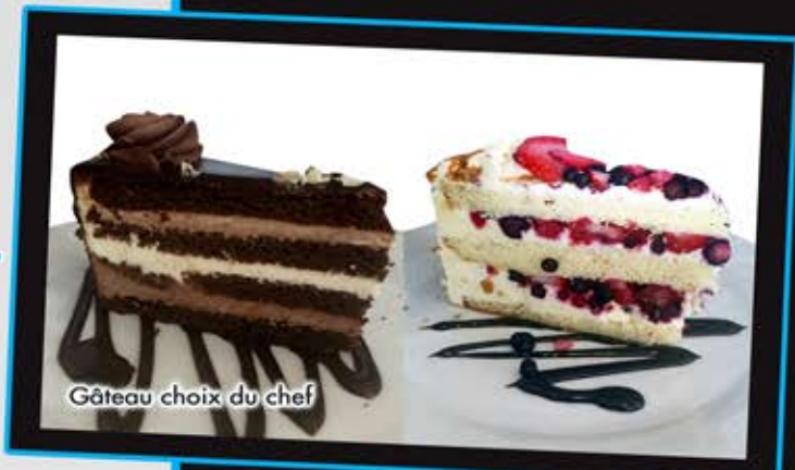
Gâteau choix du chef