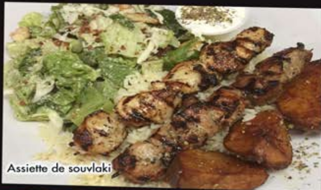
Assiette de souvlaki