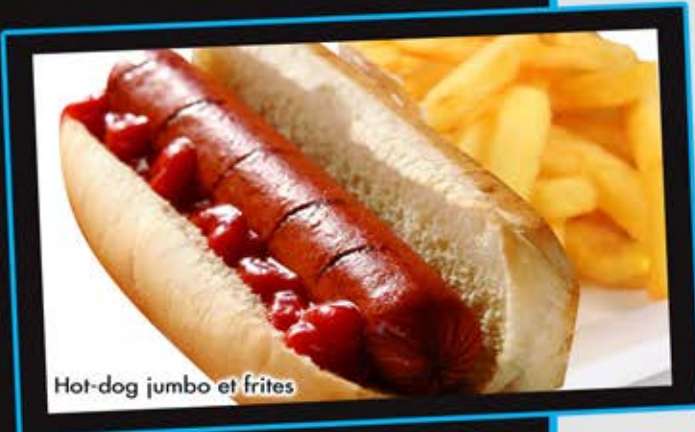
Hot-dog jumbo et frites