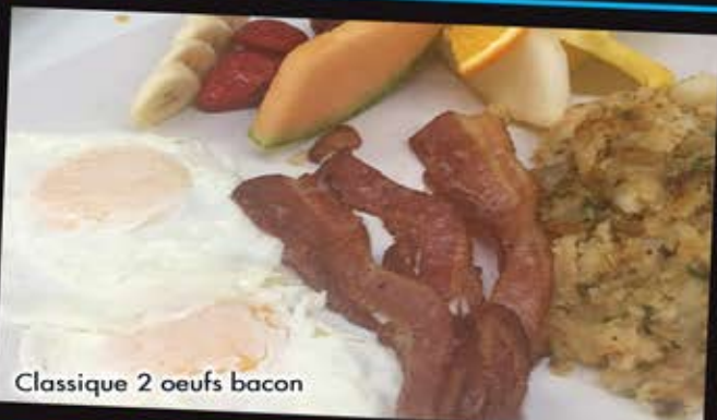
Classique 2 oeufs bacon