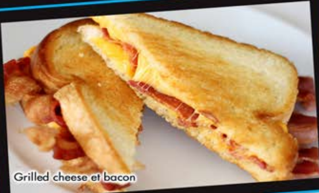
Grilled cheese et bacon