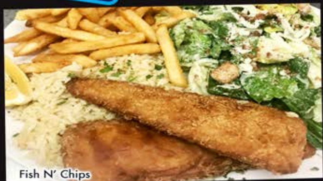
Fish N' Chips