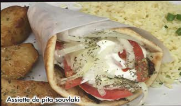
Assiette de pita souvlaki