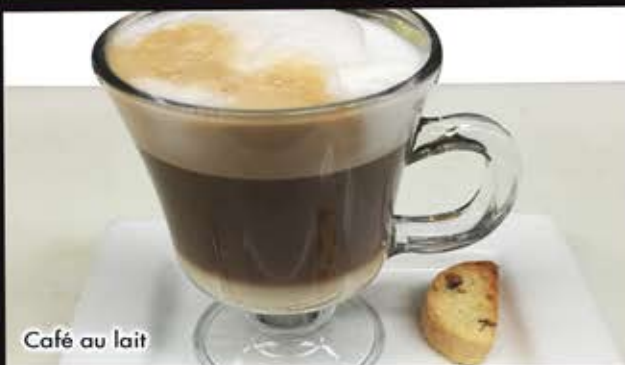
Café au lait