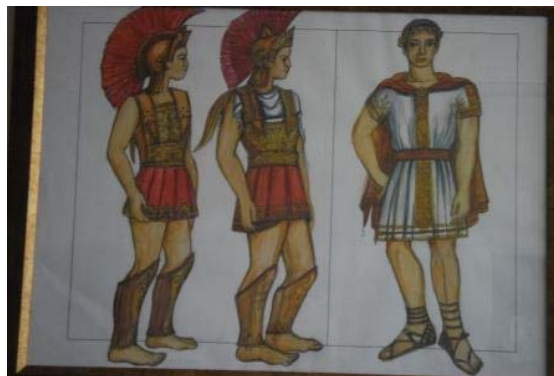
История на костюма през вековете – студио „Арт дизайн“