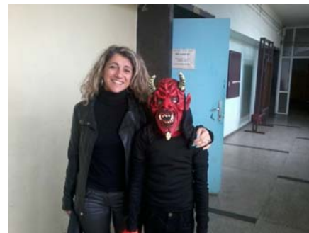
Учениците от V а клас