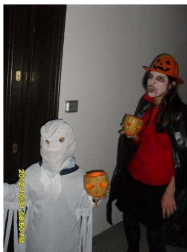
имахме запаси от сладки неща.

празника. Гримирах лицето си в бяло, начервих се и си сложих черни, тъмносини и червени сенки. Сложих си и вампирските зъби. Брат ми се облече като духче. Направихме си тиквени фенери, сложихме свещи и ги запалихме.