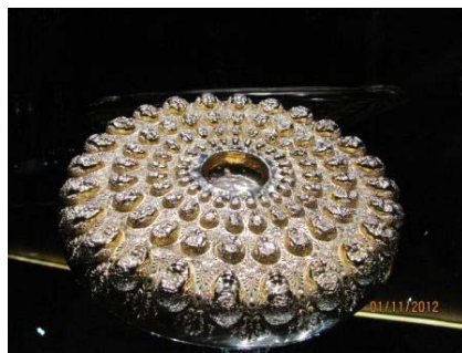
Панагюрското златно съкровище

Излишно е да казвам, че централно място в музея е отредено на копиеето на Панагюрското златно съкровище. Съзрцаването на творението на древните траки е