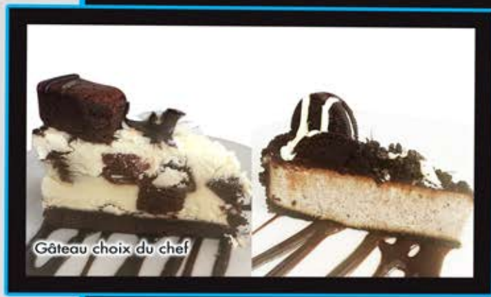
Gâteau choix du chef