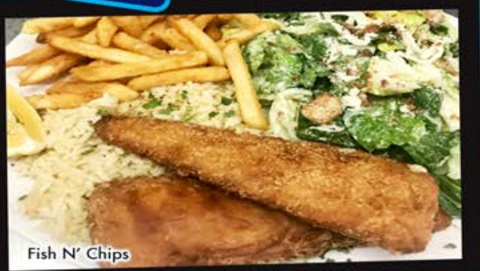
Fish N' Chips