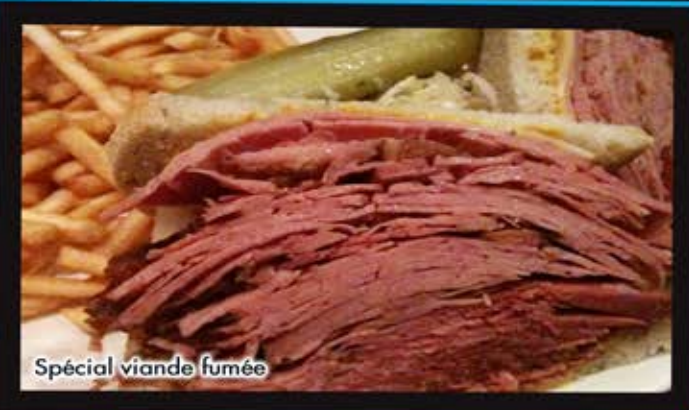
Spécial viande fumée