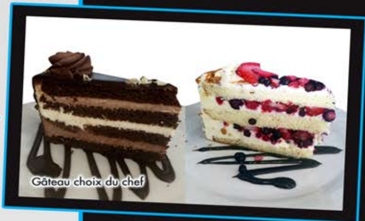
Gâteau choix du chef