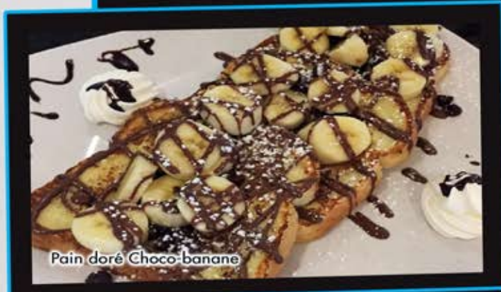
Pain doré Choco-banane