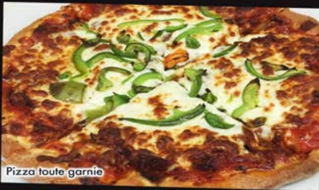
Pizza toute garnie