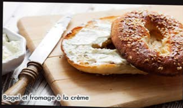
Bagel et fromage à la crème