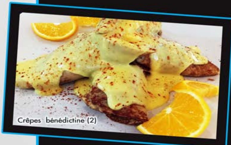
Crêpes bédicotine (2)