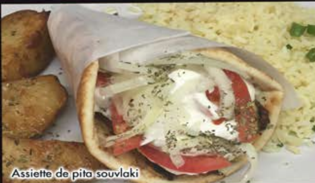
Assiette de pita souvlaki