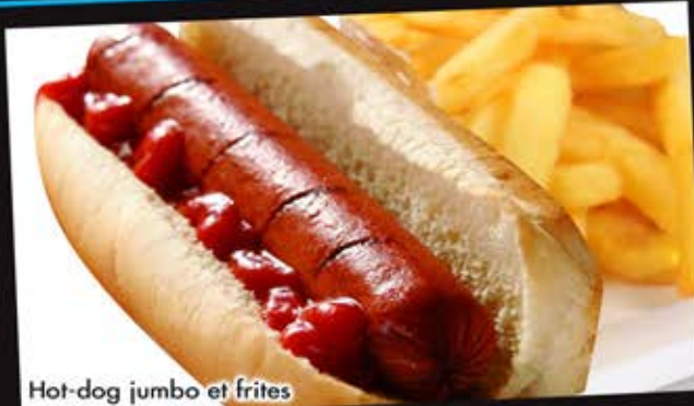
Hot-dog jumbo et frites