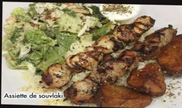
Assiette de souvlaki