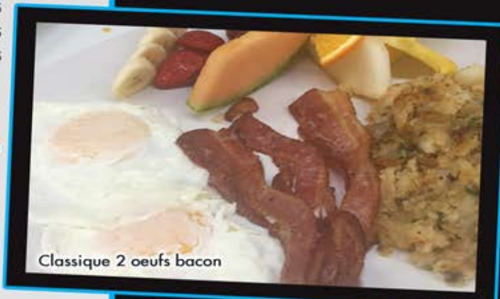
Classique 2 oeufs bacon