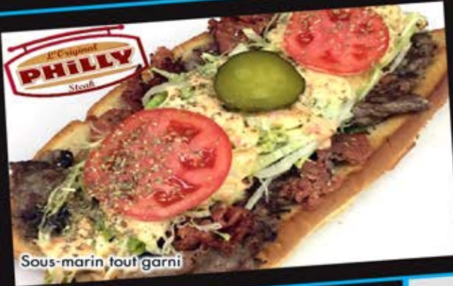
Sous-marin tout garni