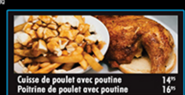
Cuisse de poulet avec poutine 14" Poirine de poulet avec poutine 16"