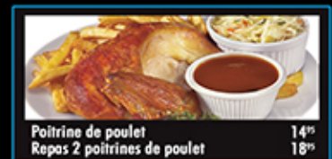
Poirine de poulet 14" Repas 2 poitrines de poulet 18"