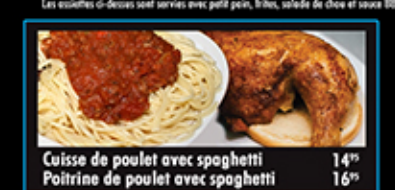
Cuisse de poulet avec spaghetti 14" Poirine de poulet avec spaghetti 16"