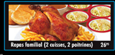
Repas familial (2 cuisses, 2 poitrines) 26"