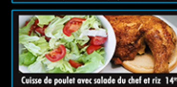
Cuisse de poulet avec salade du chef et riz 14"