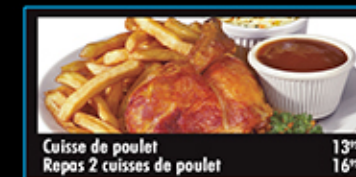
Cuisse de poulet 13" Repas 2 cuisses de poulet 16"