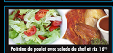
Poirine de poulet avec salade du chef et riz 16"