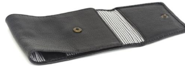
LUKE 735 ■ Porte chéquier / Cheque book Taille: 13 x 10 cm / Size: 6 x 4"