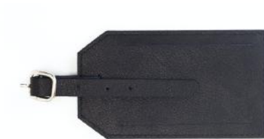
ANA 29 ■ 655 ■ Étiquette à bagages / Luggage tag Taille: 11,5 x 6,5 / Size: 4,6 x 2,6"