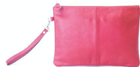
PAULETTE 624 ■ 625 ■ 626 ■ 627 ■ Pochette cuir amovible / Leather sleeve Taille: 22 x 5 x 30 / Size: 8 x 12"