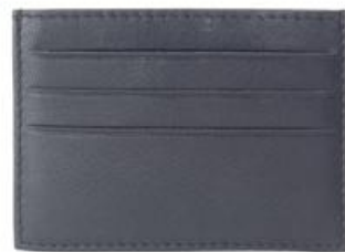
JIM 669 ■ Porte cartes de crédit / Card holder Taille: 10 x 8 / Size: 4 x 3,2"