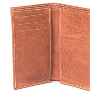
PAUL 801 ■ Porte cartes vertical / Vertical card holder Taille: 15 x 13 / Size: 7 x 6"