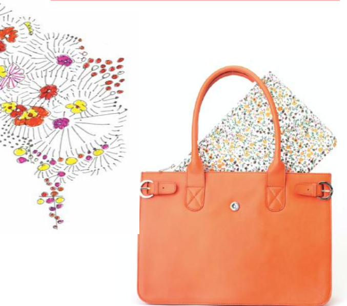
NICOLE 532 ■ 535 ■ 538 ■ 541 ■ Shopping porté main / Tote bag Taille: 40 x 27 x 13 / Size: 16 x 11 x 5"