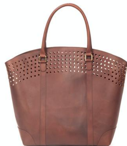
CAROLE 633 ■ 632 ■ 628 ■ 629 ■ 630 ■ 631 ■ Sac shopping / Tote bag Taille: 43 x 40 x 10 / Size: 17,2 x 16 x 4"