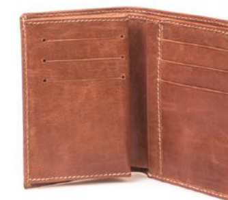
PETER 800 ■ Portefeuille homme vertical / Men's vertical wallet Taille: 17 x 12 / Size: 8 x 6"