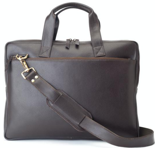
GRAHAM16 646 ■ 652 ■ Sacoche ordinateur / Laptop bag Taille: 39 x 31 x 6 / Size: 15,6 x 12,4 x 2,4"