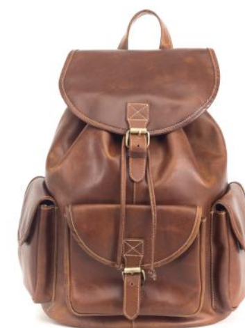
INDIANA 736 ■ Sac à dos 28L / Backpack 28L Taille: 41 x 31 x 19 / Size: 18 x 13 x 8"