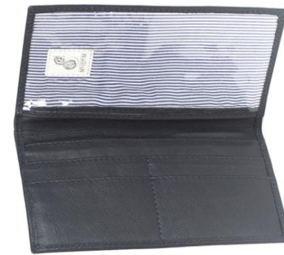
WILSON 740 ■ Porte chéquier / Cheque book Taille: 19 x 10 cm / Size: 8 x 4"