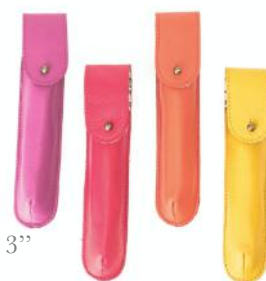
602 ■ 603 ■ 604 ■ 605 ■ Etui stylo 1 emplacement / Pen case Taille: 16 x 2 / Size: 8 x 3 x 3"