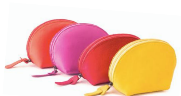
LEA 607 ■ 608 ■ 609 ■ 610 ■ Trousse de maquillage / Make up pouch Taille: 20 x 14 x 6,5 / Size: 8 x 5,5 x 2,5"