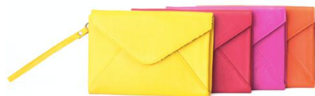
SANDRA 634 ■ 635 ■ 636 ■ 637 ■ Pochette avec sangle poignet / Clutch bag Taille: 14,5 x 21,5 / Size: 5,8 x 8,6"