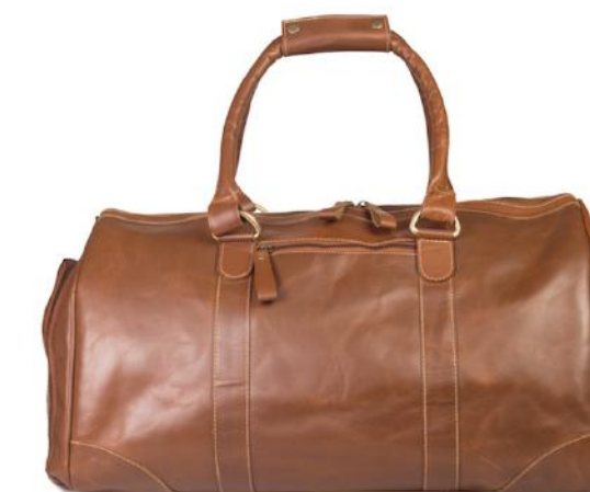
SACHA 446 ■ Avec compartiment étanche chaussures / With dry shoe store compartment Sac week end 39L / Small week end bag 39L Taille: 50 x 30 x 26 / Size: 20 x 12 x 10"