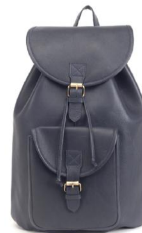
INDIANA City 737 ■ 738 ■ 739 ■ Sac à dos 20L / Backpack 20L Taille: 41 x 25 x 15 / Size: 18 x 18 x 6"