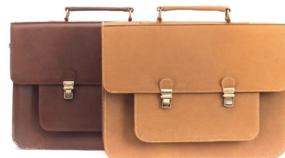
OSCAR 393 ■ 392 ■ 394 ■ 395 ■ Cartable / Satchel Taille: 37 x 25 x 10 cm / Size: 16 x 11 x 5"