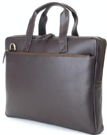
GRAHAM13 645 ■ 651 ■ Sacoche ordinateur / Laptop bag Taille: 38 x 28 x 6 / Size: 15,2 x 11,2 x 2,4"