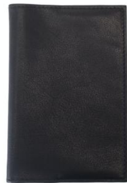
JOHN 642 ■ 656 ■ Couverture de passeport / Passport holder Taille: 9,5 x 13,5 x 8 / Size: 3,8 x 5,4 x 3,2"