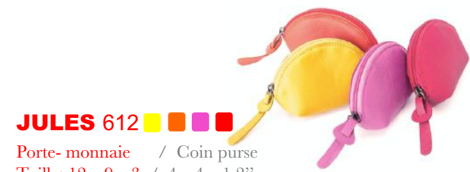
JULES 612 ■ ■ ■ ■ Porte-monnaie / Coin purse Taille: 12 x 9 x 3 / 4 x 4 x 1,2"