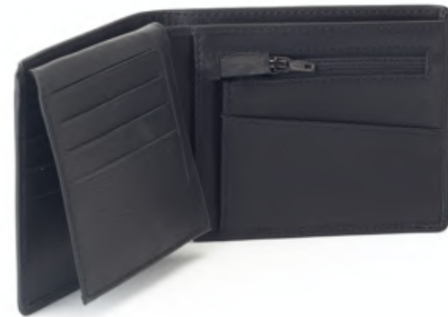
TED 369 ■ 653 ■ Portefeuille / Wallet Taille: 11 x 9 / Size: 4,4 x 3,6"