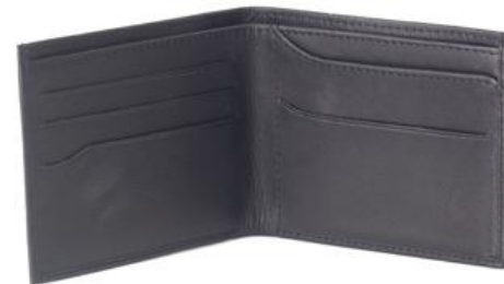
BRUCE 643 ■ 657 ■ Porte cartes/portefeuille / Wallet +card holder Taille: 11 x 9 x 8 / Size: 4,4 x 3,6 x 3,2"