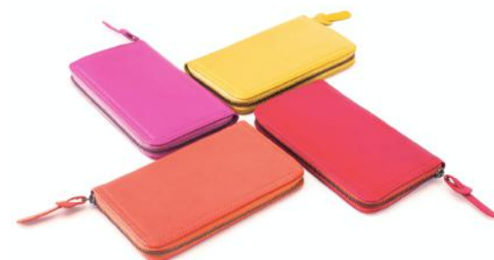
AMI 613 ■ 614 ■ 615 ■ 616 ■ Compagnon / Long wallet Taille: 19,5 x 15 x 2 / Size: 7,5 x 5 x 0,8"