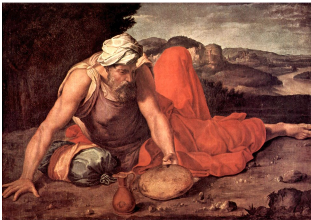
Elijah in the Desert, Daniele da Volterra

And also—this is a lot! I was remarking to a friend (herself a staff member at a parish in the archdiocese) that a danger I’ve come to recognize in Partners in the Gospel : that we allow ourselves to think that we can carry on under our own strength, attempting to be all things to all people when that is simply not possible.