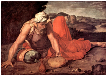
Eliás en el desierto, Daniele da Volterra

Y también, ¡esto es mucho! Le comentaba a una amiga (ella misma es miembro del personal de una parroquia de la archidiócesis) que un peligro que he llegado a reconocer en