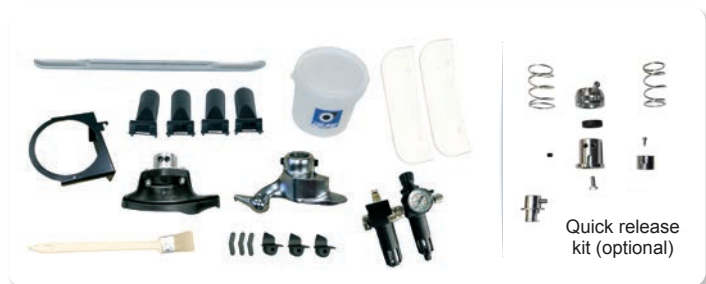
Quick release kit (optional)

THE REAL "WORK-HORSE" FOR YOUR TYRE SHOP!!