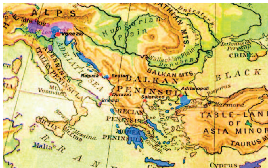
L'espansione massima di Venezia nel XVI secolo

L'11 novembre del 1500 si stipulò un accordo, tra il re di Spagna Ferdinando il Cattolico e il re di Francia Luigi XII, per spartirsi il regno aragonese di Napoli e l'accordo, nel 1504, sfociò in guerra aperta tra i due paesi alla fine della quale gli Spagnoli ebbero la meglio e Ferdinando il Cattolico divenne il nuovo sovrano di Napoli. Venezia rimase neutrale in quella guerra