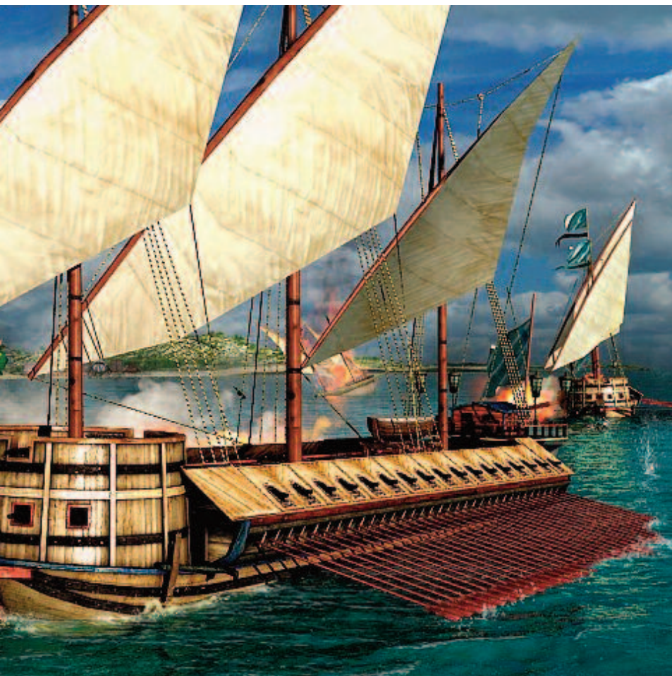
Una galea veneziana del XVI secolo