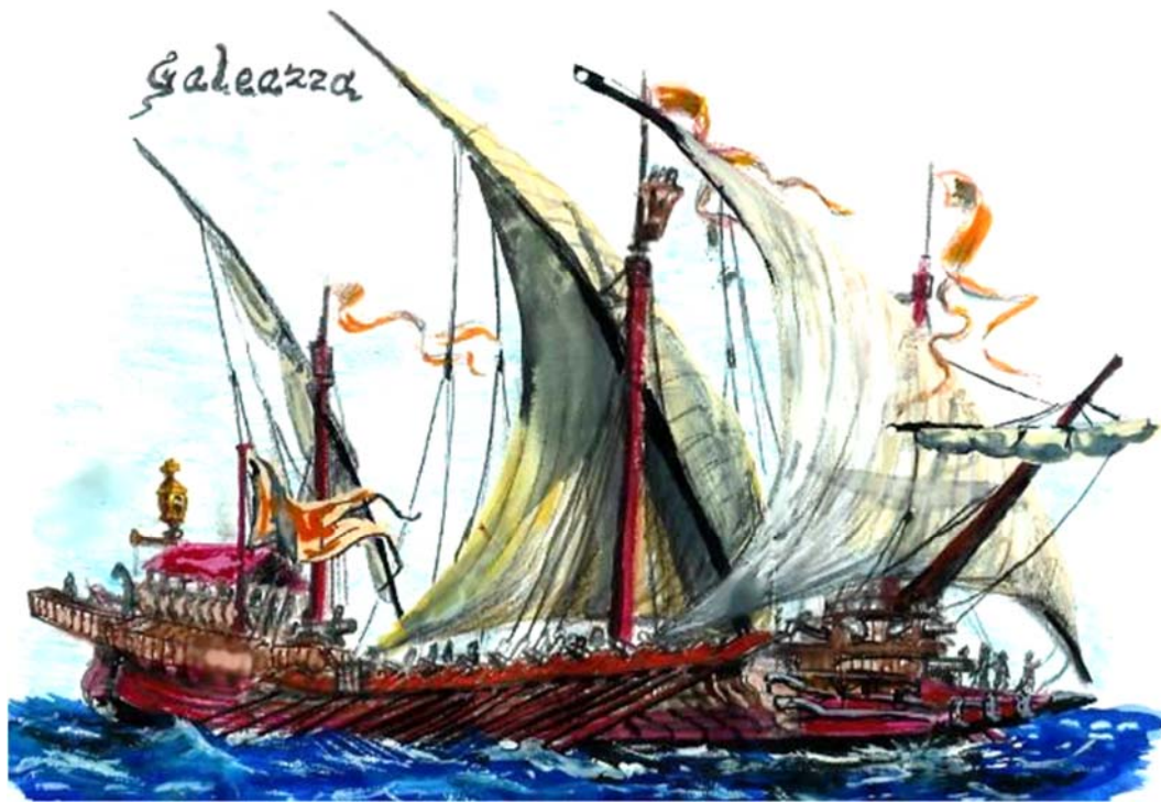
Galeazza veneziana del XVI secolo