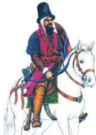
Gli Srtadioti al servizio di Venezia