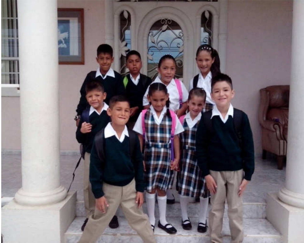
Elementary La Primaria

Todos los chicos están de vuelta en la escuela. Gracias a su ayuda, todos ellos tienen sus nuevas mochilas, uniformes, zapatos y útiles escolares. Aquí están las fotos de nuestros niños que salen de la escuela: