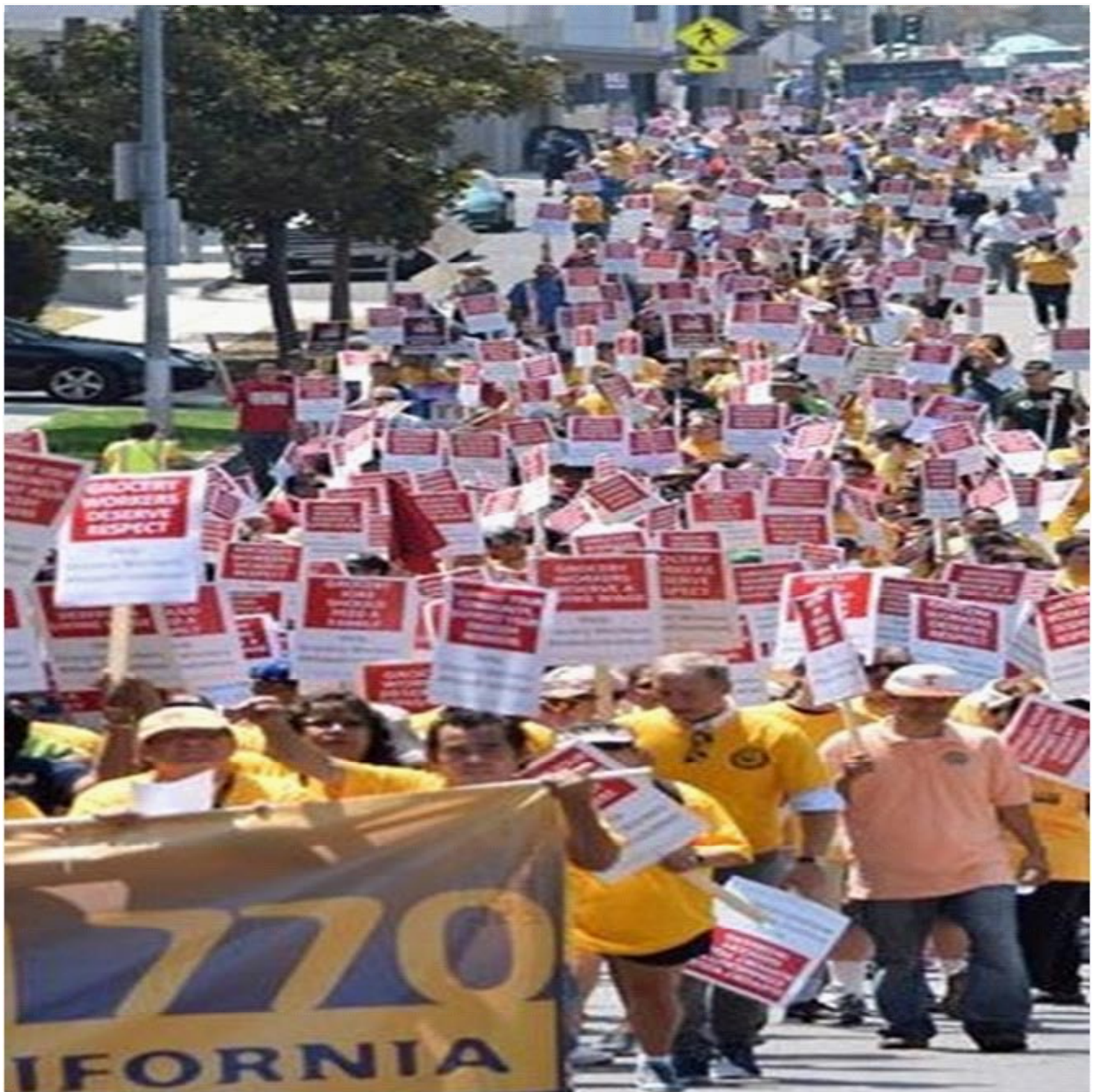
Manifestation réussie du 2 août 2016 des travailleurs et de la communauté pour un nouveau contrat pour les travailleurs des supermarchés.