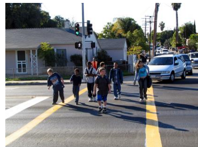
Crear cruces seguros