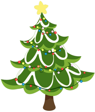
聖誕樹 shèng dàn shù