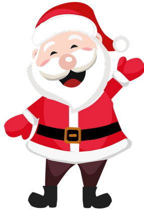
聖誕老人 shèng dàn lǎo rén