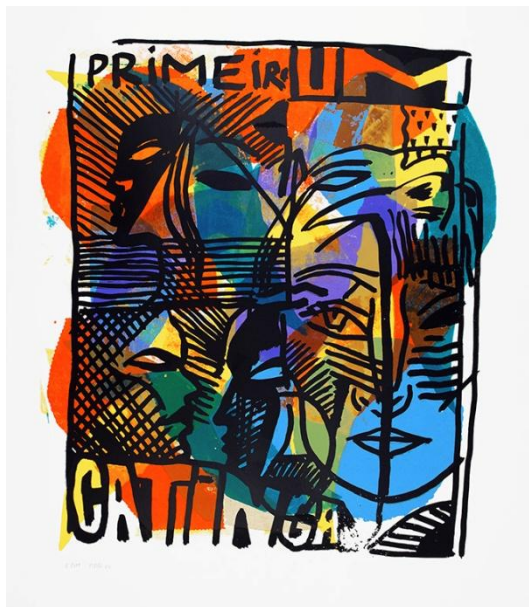
Francisco Vidal "Prometeu Agrilhado", Serigrafia, 2022