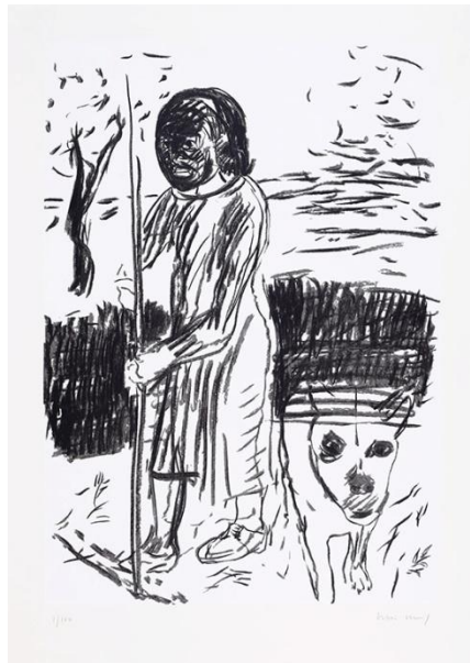
Graça Morais "Joana Carda", Serigrafia, 2022 Edição comemorativa do centenário de Saramago