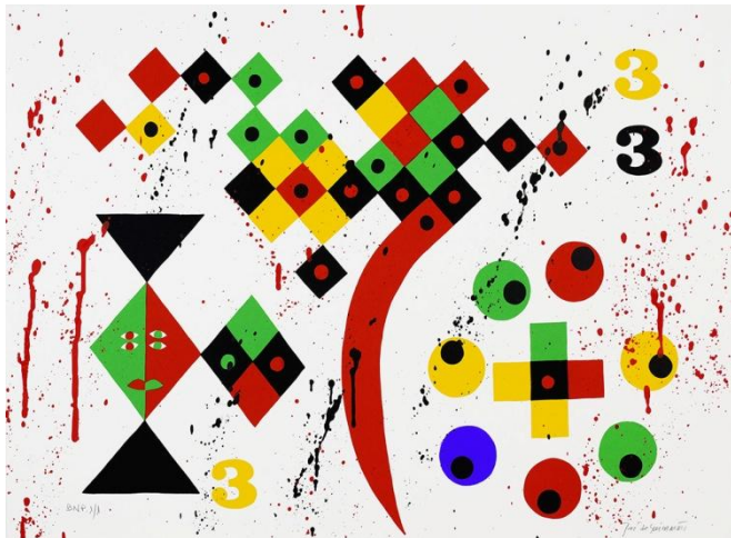
José de Guimarães "Blimunda", Serigrafia, 2022 Edição comemorativa do centenário de Saramago