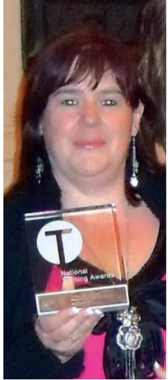
Dyma Gwenan ar noson wobrwyo Hyfforddiant Cenedlaethol yn dangos gwobr Agoriad am Ddarparu Addysg a Hyfforddiant.