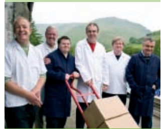
Dyma rai aelodau o'r tîm Dŵr Cerist yn Ninas Mawddwy.

Wrth inni ychwanegu at y gwerthiant, mae'r cyfleoedd hyn yn cynyddu, ac mae hyn i gyd ar sail cynnyrch lleol gwych, wedi'i gyflwyno'n fedrus, sydd ar gael i unrhyw farchnatwr sy'n dymuno cynnig dŵr mwynol am bris cystadleuol. Diolch i bawb o'n cwsmeriaid, yr hen a'r newydd."