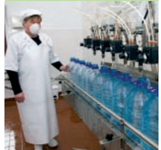
Wrthi'n potelu... digonedd o ddŵr pur Cerist.