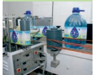
Wrthi'n rhoi'r labelau newydd ar boteli 5ltr yn Ninas Mawddwy.

Ydych chi'n cael trafferth dod o hyd i waith, neu'n gyflogwr sy'n awyddus i lenwi swydd ac yn fodlon cynnig lleoliad gwaith?