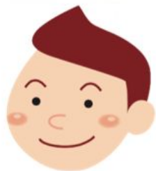
李大文 Lǐ dà wén