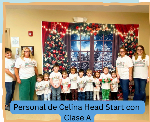
Personal de Celina Head Start con Clase A

Estas conversaciones ayudan a los niños a comprender que sus acciones importan.