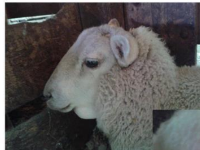
“ Bottle jaw ”