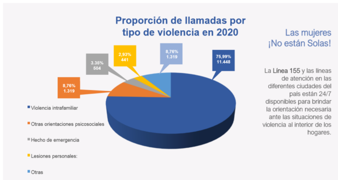
Distribución de llamadas según Tipos de Violencia 25 de marzo al 6 de agosto – 2019 / 2020

Boletín N° 20- 10 de Agosto de 2020. Observatorio Colombiano de las Mujeres. Consejera Presidencial para la Equidad de la Mujer.