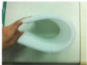
為軟性材質, 可彎曲