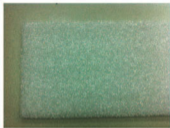
側邊防振板(側視圖)