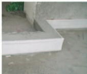
側邊防振板貼附於RC邊墩上