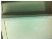
側邊防振板(上視圖) 10mmt