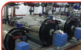
Hornos - Calderas