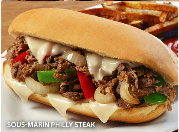
SOUS-MARIN PHILLY STEAK