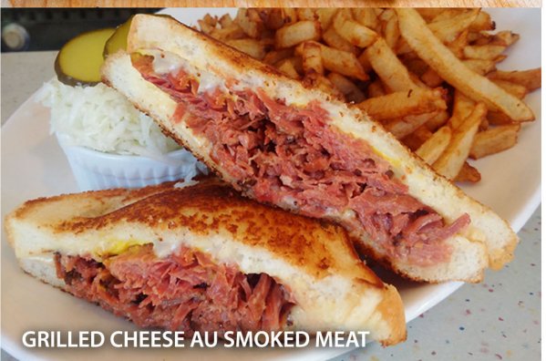
GRILLED CHEESE AU SMOKED MEAT