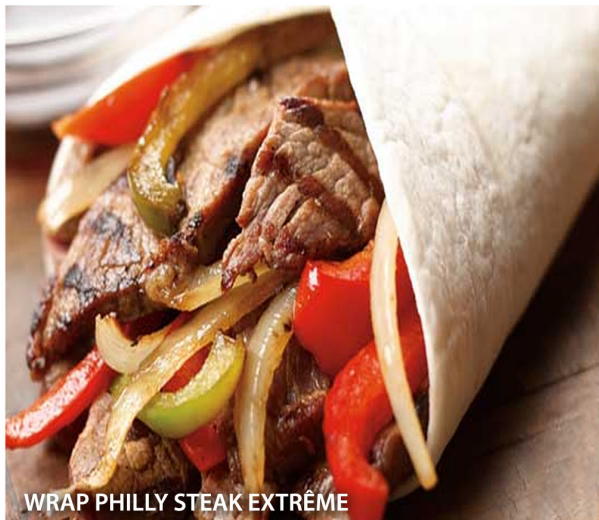
WRAP PHILLY STEAK EXTRÊME