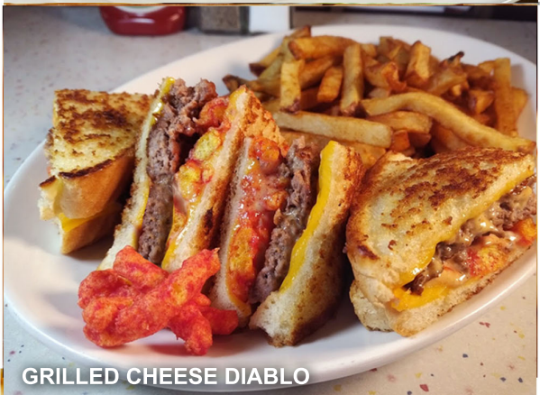
GRILLED CHEESE DIABLO