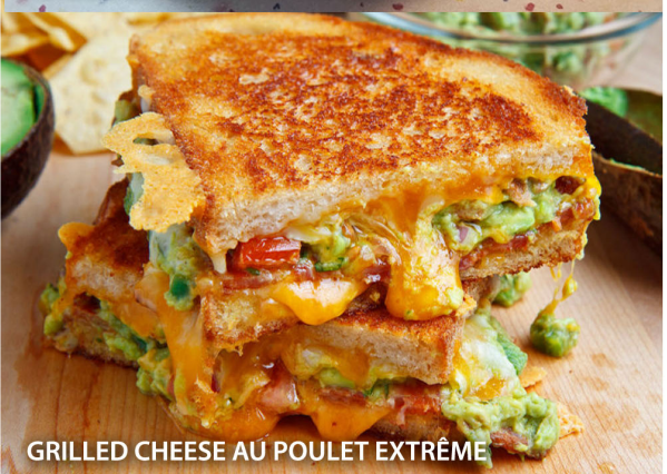
GRILLED CHEESE AU POULET EXTRÊME