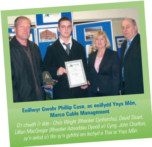
Enillwyr Gwobr Phillip Case, ac enillydd Ynys Môn, Marco Cable Management