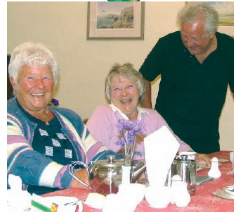
Cwsmeriaid hapus yn y caffï - "Le braf i dreulio amser!"

gyfer y boblogaeth leol ac ymwelwyr â'r ardal hynod hardd hon o'r ynys."