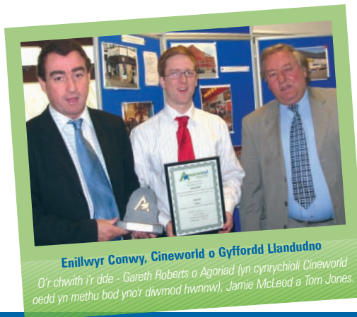
Enillwyr Conwy, Cineworld o Gyffordd Llandudno