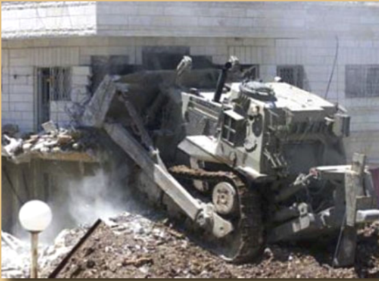
Katapila likibomoa nyumba.