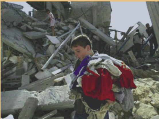
Mtoto akikusanya nguo katika magofu.

Sheria ya Kimataifa inakataza mamlaka zinazokalia au kushikilia kwa mabavu ardhi kuwahamishia watu wake katika maeneo linayoyashikilia. Hata hivyo Israeli imewahamishia nusu milioni ya raia wake kutoka Israeli na kuwahamishia Ukingo wa Magharibi inaokalia kwa mabavu, imechukua ardhi, raslimali na maji kutoka kwa Wapalestina.