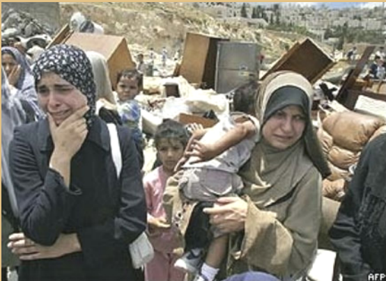
Wanawake wakihuzunika karibu na nyumba iliyobomolewa.