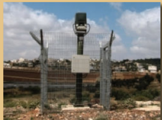
Rada ya Motorola ikilinda makazi haramu.