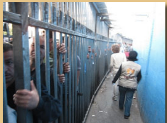
Wapalestina wakisubiri katika kituo cha ukaguzi cha HP.