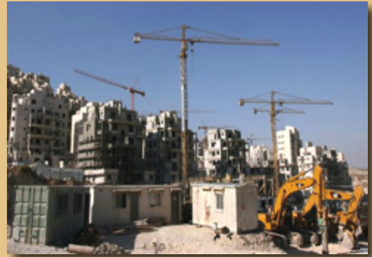
Kifaa cha Caterpillar kikijenga makazi.

Umoja wa Bodi za Kanisa la United Methodist na wakala zake, zimejhusisha katika kampeni za wabia za makampuni ya Caterpillar, Motorola Solutions na Hewlett Packard kwa miaka mingi bila maendeleo yo yote ya maana. Makampuni haya yanaendelea kupata faida kwa kuwezesha ukaliaji wa ardhi ya Wapalestina kimabavu. Ni wakati kwa kanisa la United Methodist kukata mahusiano yake na makampuni haya mpaka yatakapoacha kusaidia ukaliaji wa ardhi ya Wapalestina kimabavu ambao kanisa letu kwa uwazi linaupinga.