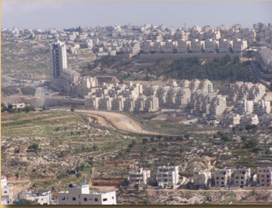
Makazi haramu yanatawala Bethlehemu.