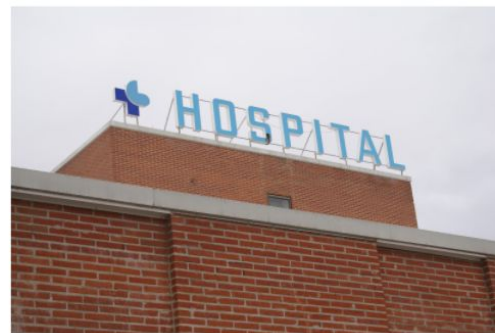
醫院 yī yuàn