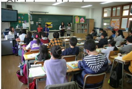
學校 xué xiào