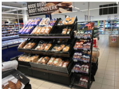
超市 chāo shì