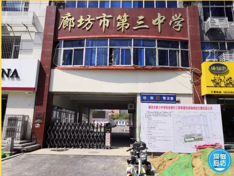
My middle school Langfang No.3 Middle School