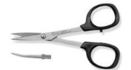
N5350 qté : 1 dentelé Kai®