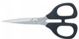
N5250 qté : 1 couture Kai®