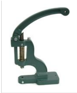
TR18 qté : 1 machine manuelle à pression