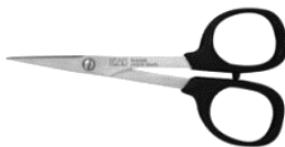
N5210 qté : 1 couture Kai®