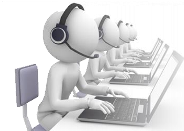
Cursos de Seguridad y Nuevas Tecnologías

La titulación será remitida al alumno/a por correo, una vez se haya comprobado el nivel de satisfacción previsto (75% del total de las respuestas).