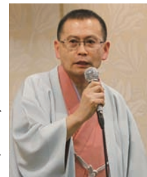
→若木家元翁さんはアマチュアながら高座歴四十数年の大ベテラン。師匠と呼ぶにふさわしい磨かれた話芸で会場を盛り上げます。