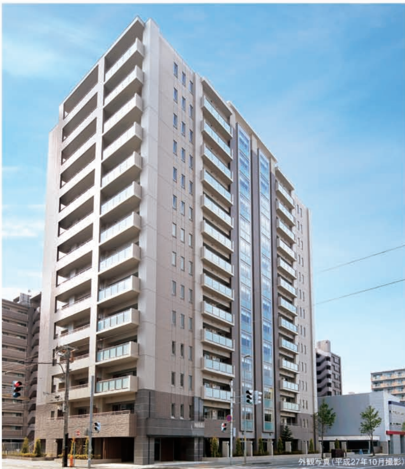
外観写真(平成27年10月撮影)