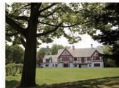
北海道知事公館(約660m)