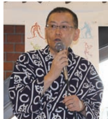
↑夏は浴衣姿の若木家、元浴師の若木家、小翁師でホッとする小翁師を届けてくれる。

サッポロ生、エビス生、エビス(ザ・ブラック)などの好みのドリンク飲み放題で懇親を深めた真夏のビール日和の午後。大いに飲み、食べ、語らい、心身ともに満たされた頃、若木家元翁さんの小咄に笑い、景品が当たるミニ・クイズ大会に沸き、会場は明るい恵比寿顔でいっぱい。札幌を愛する人たちの想いがある恵比寿のビヤレストランは、まさに「サッポロビール園」のようです。