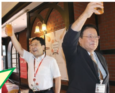
↑金曾会長の「皆さん、今からこころはサッポロビール園です!」の言葉のように、出来立てのサッポロビールを飲むほどに、酔うほどに、札幌の夏の情景を思い出しつつ、会話が弾みます。

そして、待ちかねた乾杯の合図は、今年もやっぱり「ブラボー サッポロ」。まずは会場に流れるCDの音楽を聴いてリハーサル(を本番と勘違いして、フェイントになってしまった一幕も…)の後、元気に「ブラボー サッポロ!」と歌い上げ、高らかに乾杯。渴いたノドに出来るだけの生ビールを流し込みました。