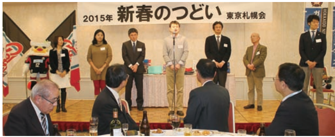
↑この1年間に新たに入会した会員が紹介され、新春のつどいにご参加くださった7名が壇上で自己紹介とご挨拶を。