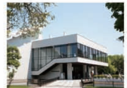
北海道立近代美術館(約530m)

※徒歩分数は80mを1分として算出しております。※周辺環境は将来変わる場合がございます。 ※掲載の環境写真は平成26年5月撮影。