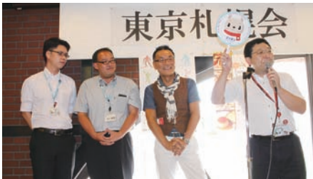
↓道産子、札幌っ子なら、ビールはやっぱり「サッポロの生(ナマ)」!!