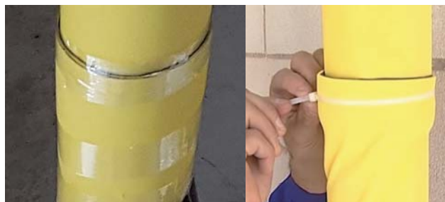
6. 膠帶固定(亦可束帶補強固定)