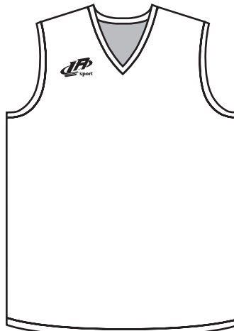
BB-01-T Longue Tall