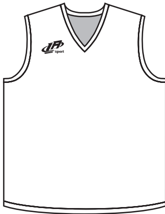
BB-01-R Régulière Regular