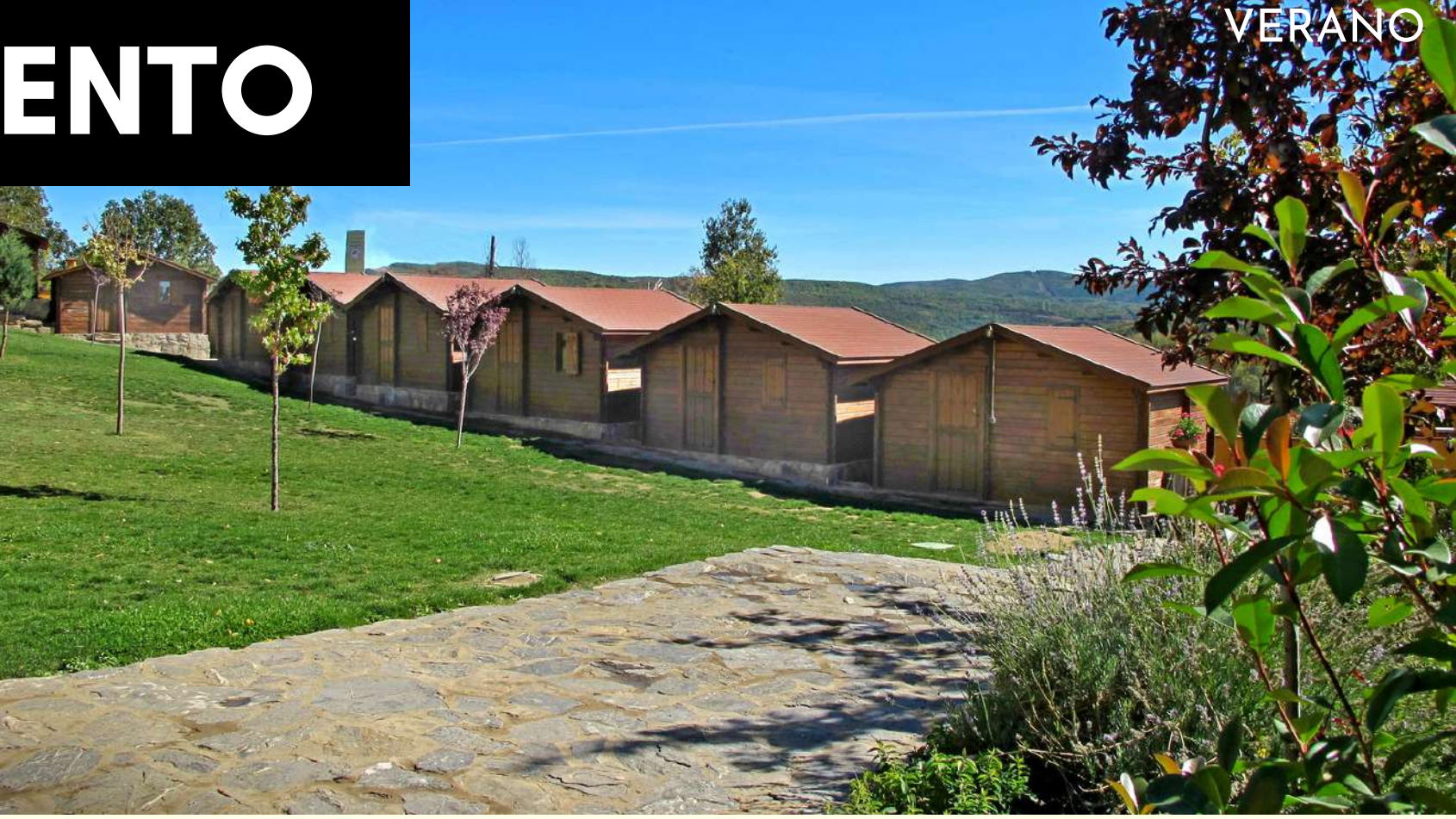
Alojamiento en albergue, cabañas o bungalows