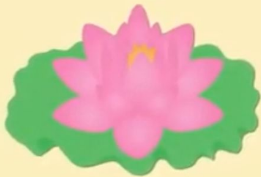
hé huā 荷 花