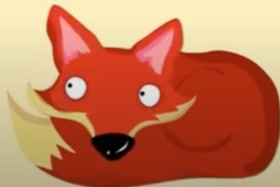
hú li 狐 狸