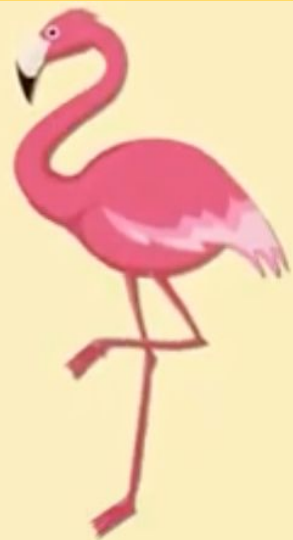
hóng hè 红 鹤