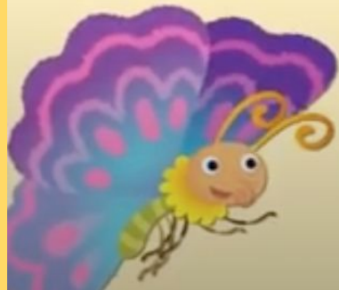
hú dié 蝴 蝶