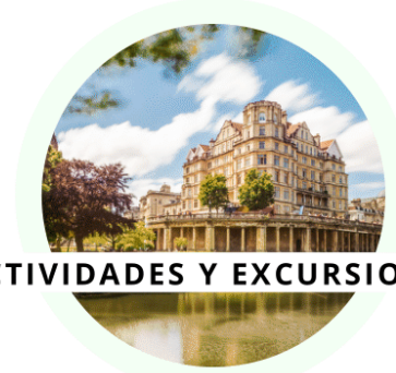
ACTIVIDADES Y EXCURSIONES

El programa de 3 semanas de duración incluye 3 visitas de 1/2 día a lugares de interés en Bath como el museo de Jane Austen y 4 excursiones de día completo.