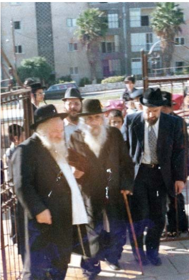
תמונה נדירה של מרן שליט"א עם להבחל"ח מרן בעל הקהילות יעקב ז"ע