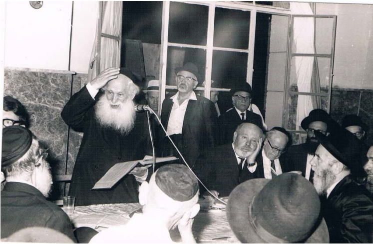
הגרי"ש כהנמן ז"ע הרב מפוניבז'