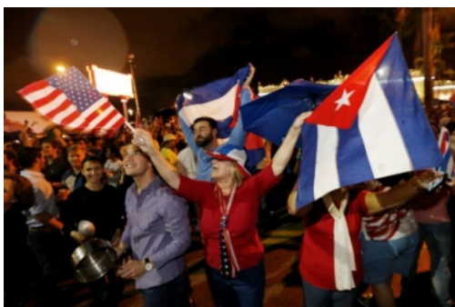
Celebración en La Pequeña Habana tras la muerte de Fidel Castro.

El Fondo para la Preservación Histórica (NTHP, en inglés) dio esta distinción al vecindario por ser un "testamento del espíritu inmigrante que construyó Estados Unidos", según escribió en un comunicado.