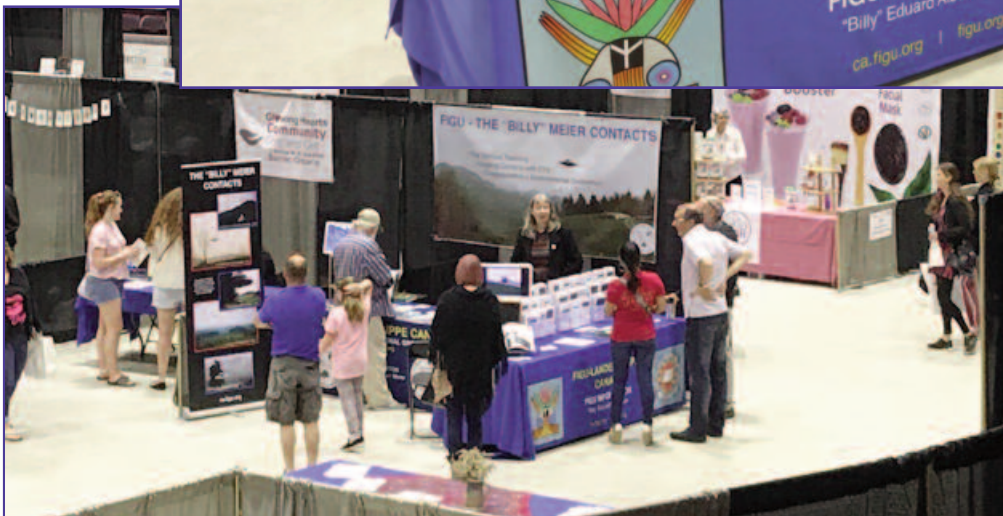
IEWS OF THE FLCA-FIGU INFO BOOTH IN BARRIE, ONTARIO FOR THE FIRST TIME