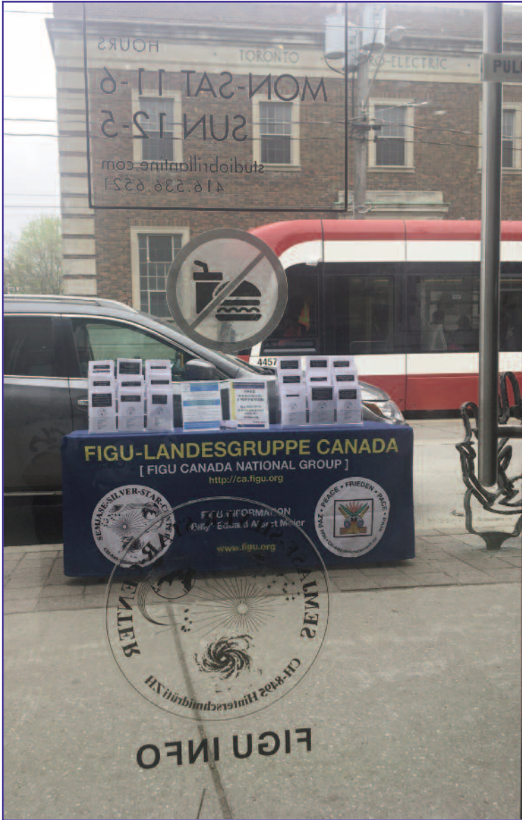
THE "SELF-SERVE" FLCA-FIGU INFO TABLE SEEN THROUGH THE GLASS DOOR OF STUDIO BRILLANTINE SHOP

SPRING INTO PARKDALE STREET FESTIVAL 2019 TORONTO, ON / MAY 11, 2019 FLCA-FIGU INFO TABLE@STUDIO BRILLANTINE