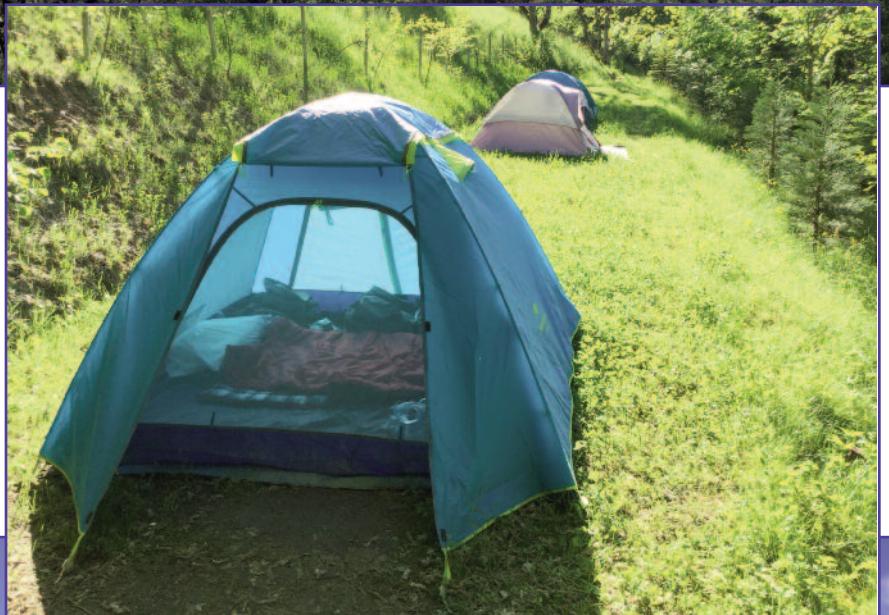
JIMMY'S TENT CAMPING ON THE SSSC GROUNDS