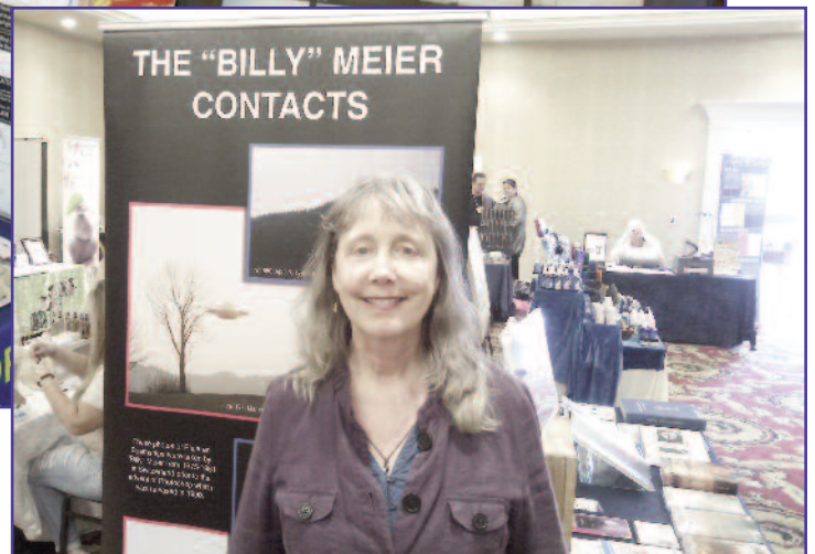
Salome, FIGU-LANDESGRUPPE CANADA