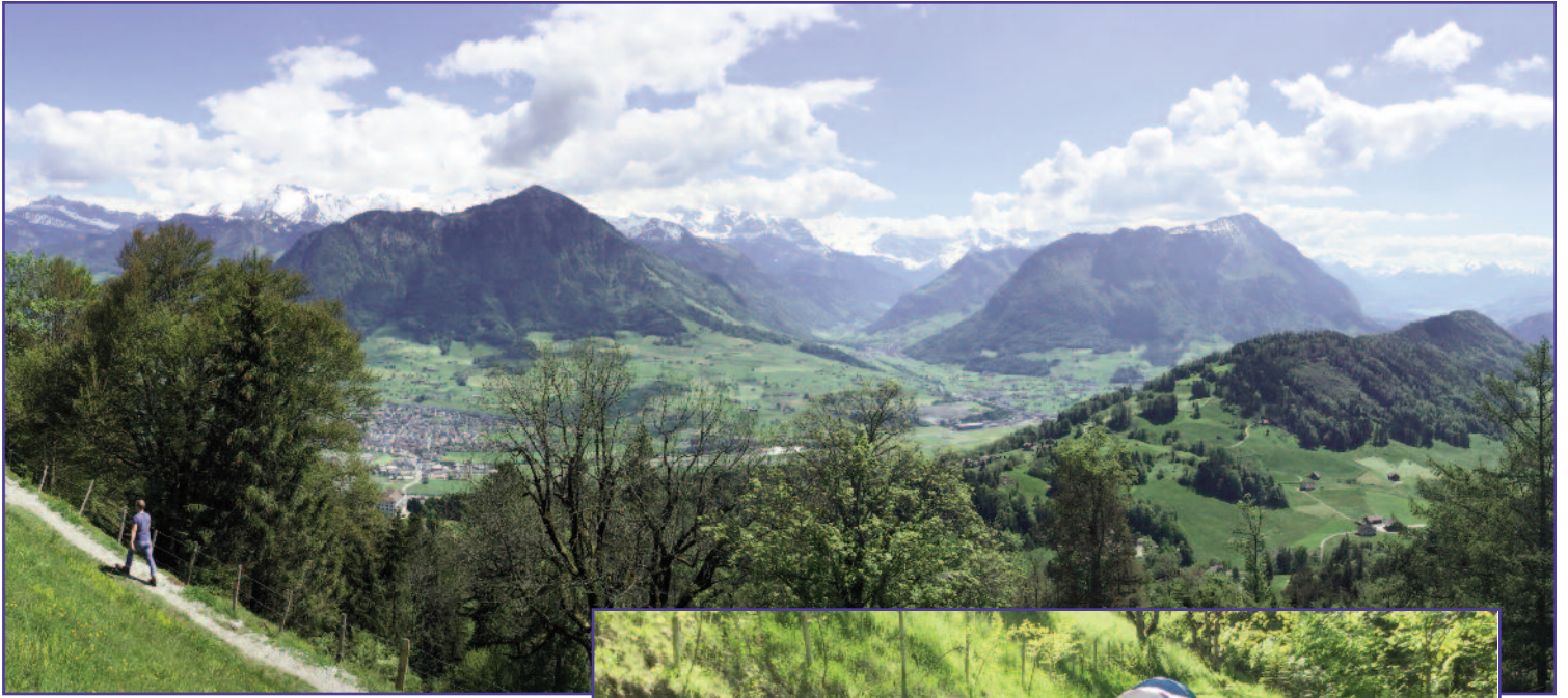
A SIDE TRIP TO BURGENSTOCK [TOP, BOTTOM]