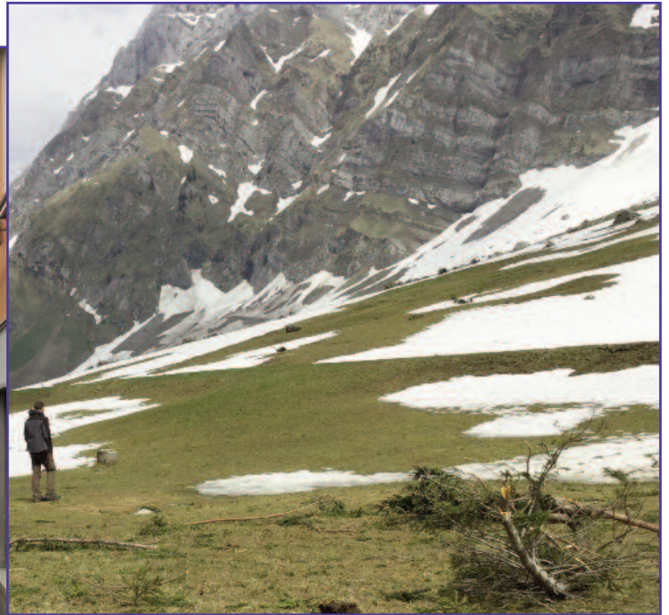
AT SANTIS - AN AVALANCHE AFTERMATH