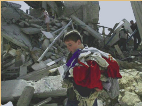
Mtoto akikusanya nguo katika magofu.

Sheria ya Kimataifa inakataza mamlaka zinazokalia au kushikilia kwa mabavu ardhi kuwahamishia watu wake katika maeneo linayoyashikilia. Hata hivyo Israeli imewahamishia nusu milioni ya raia wake kutoka Israeli na kuwahamishia Ukingo wa Magharibi inaoukalia kwa mabavu, imechukua ardhi, raslimali na maji kutoka kwa Wapalestina.