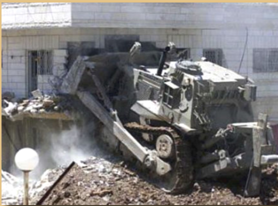
Katapila likibomoa nyumba.