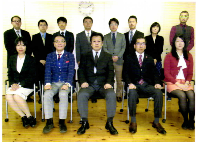
↑札幌市東京事務所職員一同

これから札幌は雪のシーズンを迎えます。年間6mを超える雪が降る190万都市は世界でも札幌だけです。その雪という資源を最大限に活かし、世界に誇れるウィンタースポーツ都市を目指す札幌では、来年3月に「世界女子カーリング選手権大会」を開催。さらに、2017年には「冬季アジア札幌大会」が開催されます。そして、その先には「冬季オリンピック・パラリンピック」の札幌開催(先ごろ招致表明)という大きな夢があります。