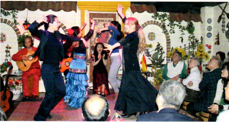
←↑ギタリスト2名、女性の歌手(カンタオーラ)1名、女性の踊り手(バイラオーラ)2〜4名による熱いステージに魅せられたひととき。会場の「CASA ARTISTA」は、1962年創業の元祖タブラオ(フラメンコショーが観られるスペインレストラン)