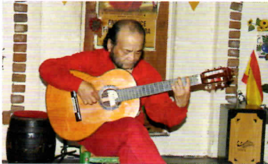
↓友人、知人と誘い合わせて参加した会員も多数。皆で陽気に飲んで、食べて、ショーを楽しんで、笑顔あふれる日曜の午後になりました。