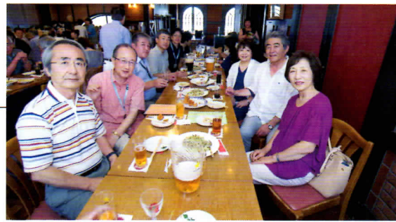
↑東京で仲間と飲むサッポロビールの味わいは格別です!