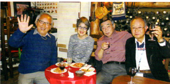
↑→第二部は26人でゆったりとお店を貸し切りに。ステージの趣も異なり、第一部から引き続き参加して下さった方も、より楽しめる内容でした。