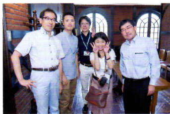
→東京札幌会の事務局を置かせていただいている札幌市東京事務所の職員の方々が、会場の皆さんにご挨拶。