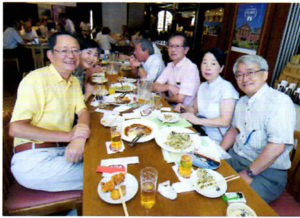
←大のビール党もワイン派も飲めないタチの人も、それぞれに楽しい同郷の集い。