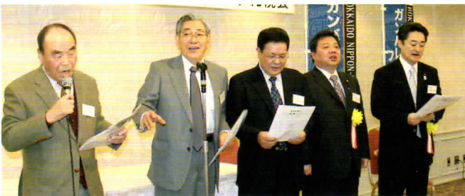
↑楽しい宴のフィナーレは、会場の全員で声を合わせて「ふるさと」を合唱(熱唱!?)。

美味と評価の高いホテルグランドパレスの料理を楽しみ、和やかな歓談が続く中、ご出席の国会議員、協賛各社、新入会員がそれぞれ紹介されました。 新春演芸ショーの皮切りは、おなじみの噺家・若木家元翁師匠(当会会員)。