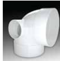
CODO 90° C/SALIDA TRASERA Y/O LATERAL