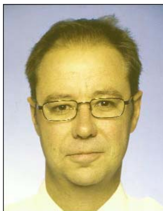
Μη φυσιολογικό χρώμα