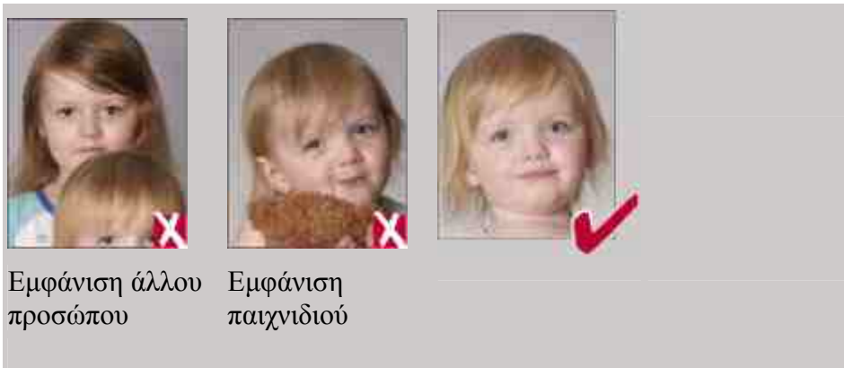
Εμφάνιση άλλου προσώπου