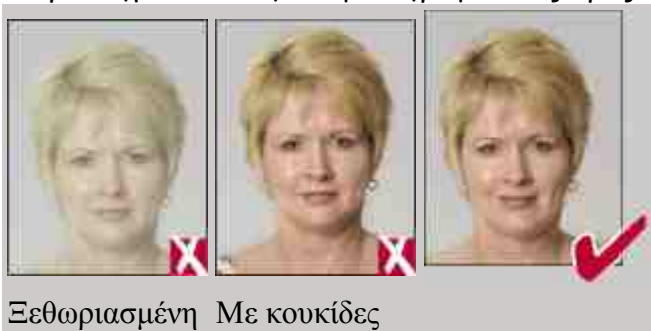
Ξεθωριασμένη Με κουκίδες

Παράδειγμα κατάλληλων φωτογραφιών ως προς το φωτισμό