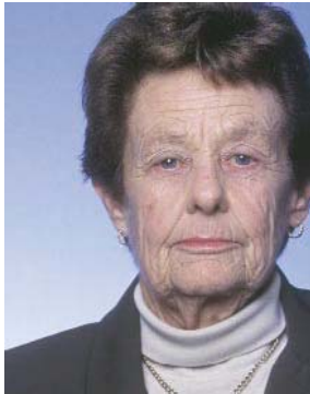
Πρόσωπο όχι στο κέντρο

Τα κατά προσέγγιση μεσαία σημεία του στόματος και της γέφυρας της μύτης θα βρεθούν σε μια φανταστική κάθετη γραμμή AA που τοποθετείται στο οριζόντιο κέντρο της εικόνας.