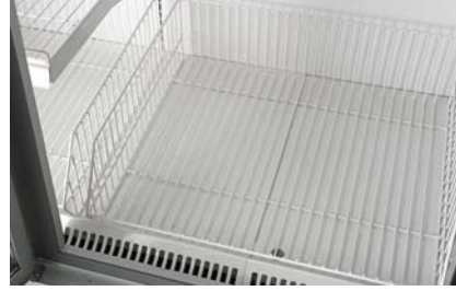
Tel basket Wire basket