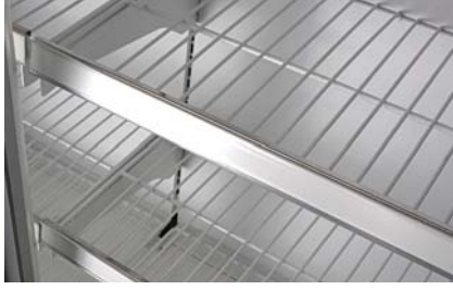
Tel raf Wire shelves