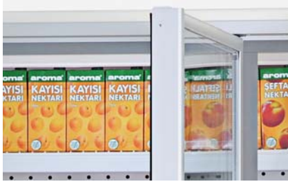
Alüminyum cam kapı Aluminium glass door