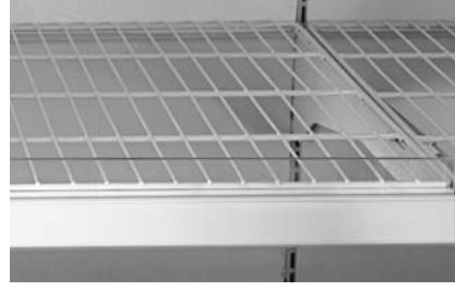
Pleksi ürün durdurucu Plexi front riser