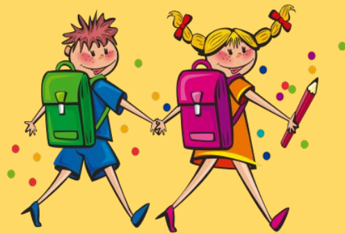
zǒu lù 走 路