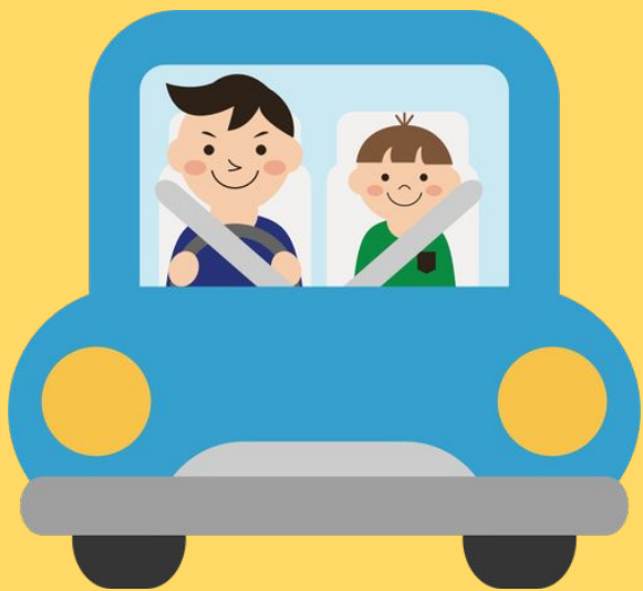
kāi chē 開 車