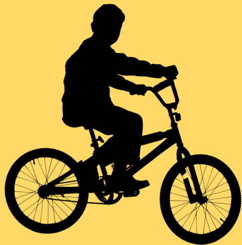
qí zì xíng chē 騎 自 行 車